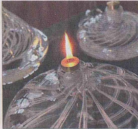
Öljykynttilöissä on myös filigraanikoristelua.