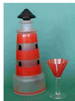
Göran Hongell: Majakka -karahvi