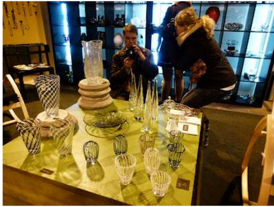
Verstakon myymälän puolellakin oli paljon kuvattavaa.