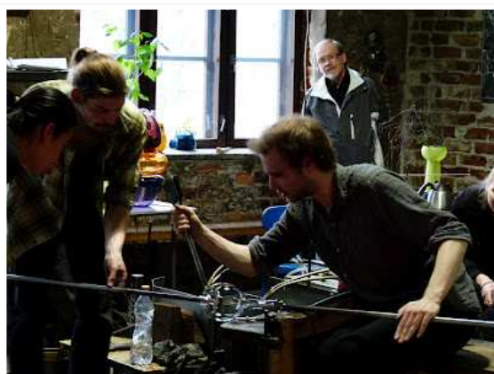
Lasismin studiossa yleisö pääsi tutustumaan taidelasin valmistukseen.

Tapahtumasta voisi kehittää jokavuotisen tapahtuman. Tällä kertaa se liittyi Riihimäen lasinpuhaltajakerhon 40-vuotisjuhlintaan.