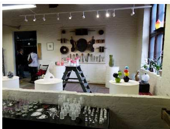
Lasimin myymälän puolelta johti ovi lasihyttiin.